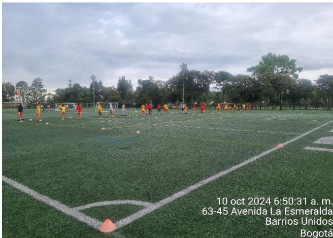
Obligación N.1 Rondo 4 vs 2