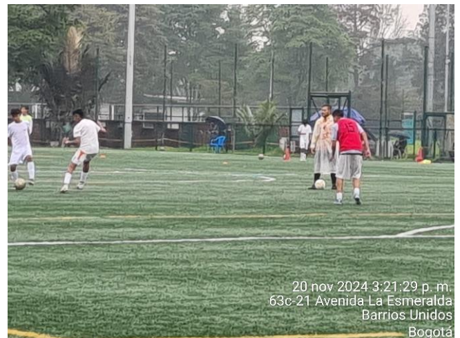
Obligación N. 3 Parte principal trabajo táctico analítico