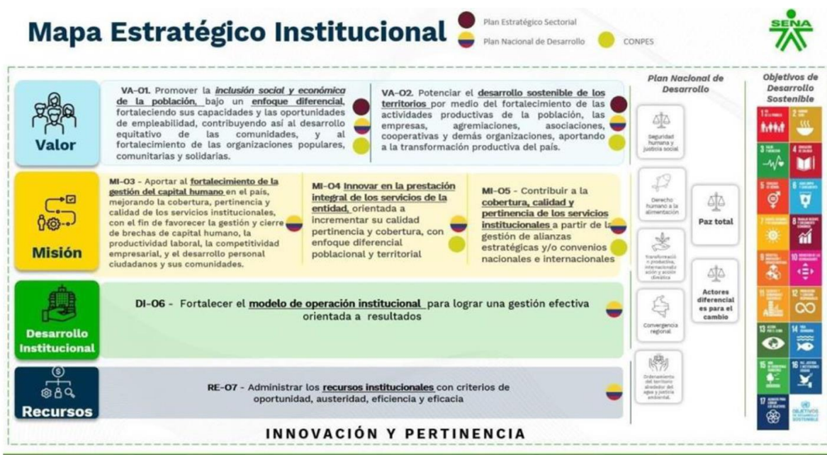
Fuente: Plan de Acción 2025 Transformando Juntos: Formación para el cambio

En consecuencia, a lo descrito anteriormente, El Mapa Estratégico Institucional incluye cuatro perspectivas institucionales y siete objetivos estratégicos, que se detallan a través de indicadores e iniciativas. Esta estructura permitirá que el SENA cumpla con su misión y visión, además de contribuir a las estrategias y prioridades fijadas por la administración en línea con las apuestas del gobierno nacional.