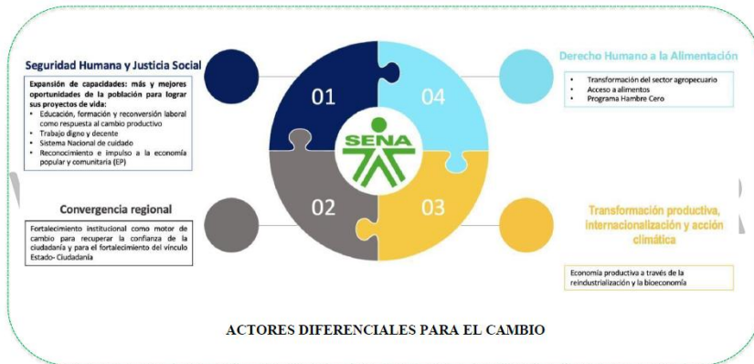
Ilustración 4 Alineación con Plan Nacional de Desarrollo 2022 – 2026