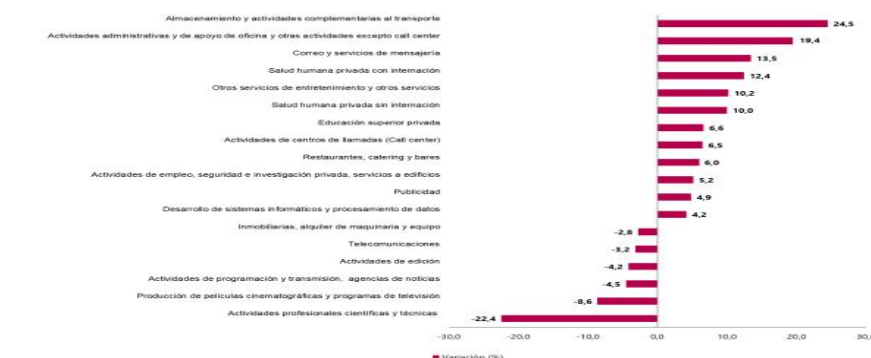
Gráfico 1. Variación anual de los ingresos nominales, según subsector de servicios Total nacional Octubre 2024 P / octubre 2023

“SOGAMOSO CIUDAD DEL SOL, PUEBLO DE ACERO”