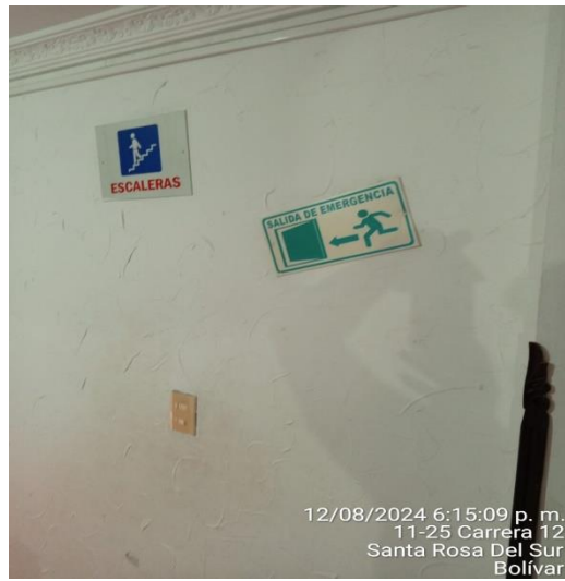
12/08/2024 6:15:09 p. m. 11-25 Carrera 12 Santa Rosa Del Sur Bolívar