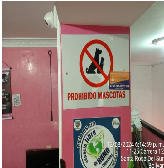
12/08/2024 6:14:59 p. m. 11-25 Carrera 12 Santa Rosa Del Sur Bolívar