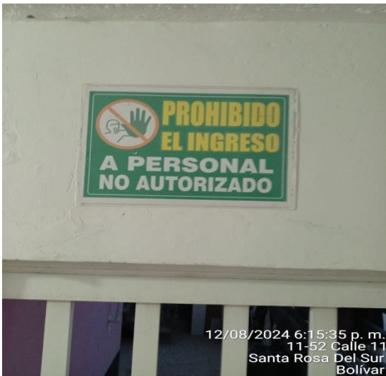
12/08/2024 6:15:35 p. m. 11-52 Calle 11 Santa Rosa Del Sur Bolívar