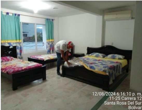
12/08/2024 6:16:10 p. m. 11-25 Carrera 12 Santa Rosa Del Sur Bolívar