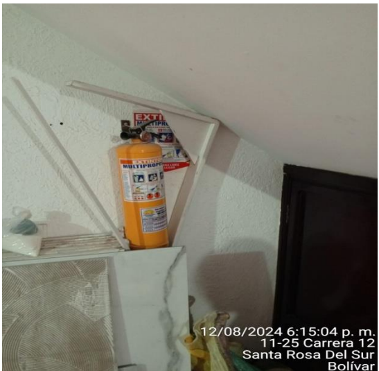
12/08/2024 6:15:04 p. m. 11-25 Carrera 12 Santa Rosa Del Sur Bolívar