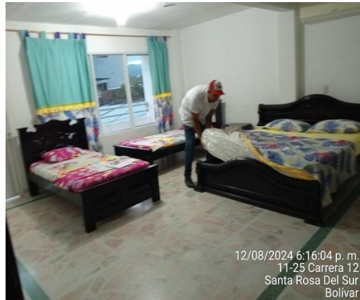
12/08/2024 6:16:04 p. m. 11-25 Carrera 12 Santa Rosa Del Sur Bolívar