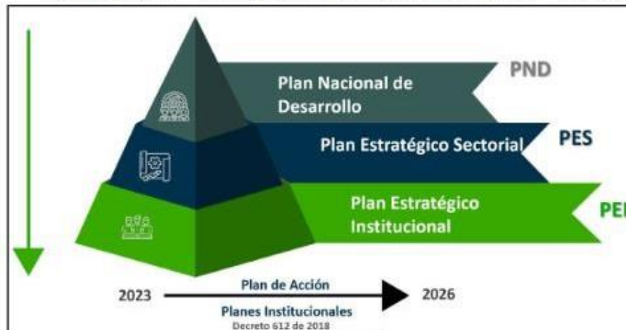
Ilustración 2 Alineación normativa PEI 2023 – 2026

Conforme a los lineamientos del Plan de Acción 2023-2026, Sembrando el Cambio: Por la inclusión, la sostenibilidad, y la seguridad humana ; se propone realizar esfuerzos orientados a garantizar que todas las acciones y recursos de la entidad estén alineadas al plan estratégico institucional 2023 – 2026 y enfocados en atender su propósito fundamental. Por consiguiente, corresponde a la Dirección General de manera conjunta con las Direcciones Regionales y Centros de Formación llevar a cabo actuaciones encaminadas al cumplimiento de los objetivos. Todas las actuaciones que se llevarán a cabo para los propósitos del Plan de Acción, están soportadas en las Bases del Plan Nacional de Desarrollo PND 2022-2026 Colombia Potencia Mundial de la vida, con sus correspondientes pilares, transformaciones e implicaciones: