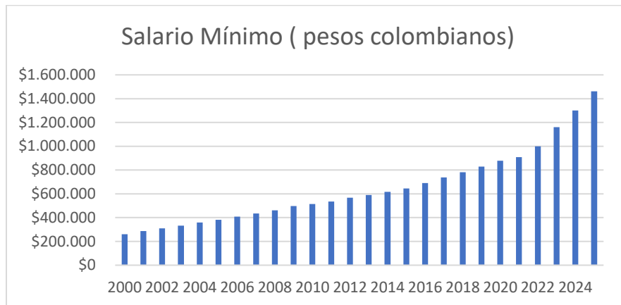
Grafico. Variación histórica del SMMLV en Colombia