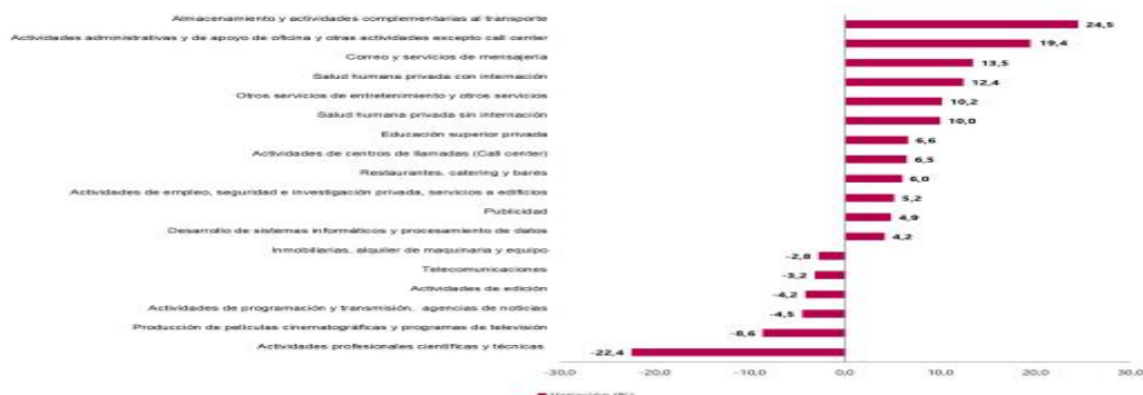
Gráfico 1. Variación anual de los ingresos nominales, según subsector de servicios Total nacional Octubre 2024 P / octubre 2023