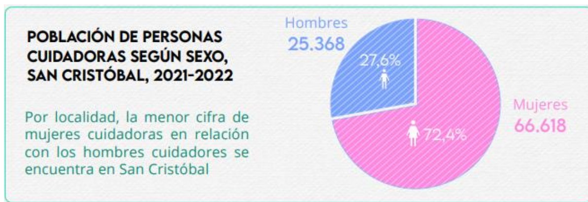
Ilustración 1. Población de personas cuidadoras según sexo.