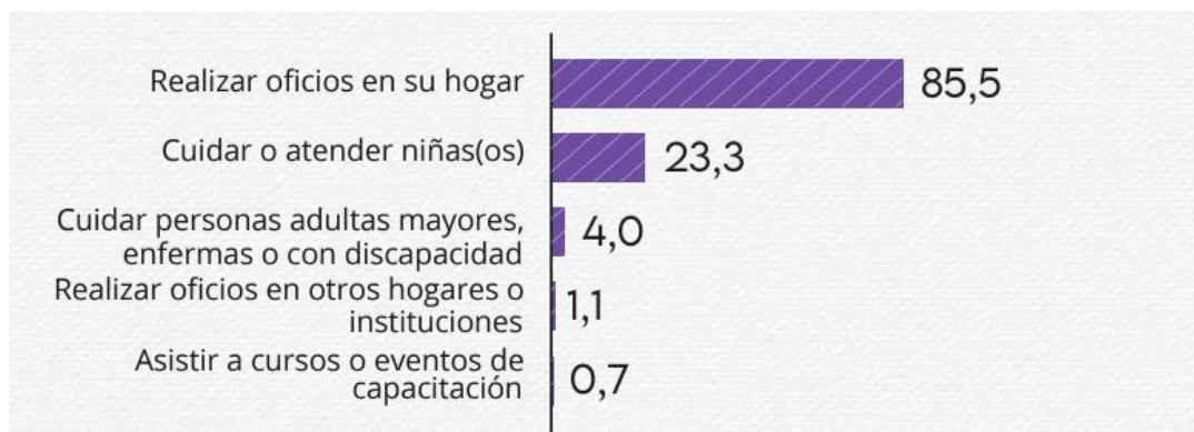
Ilustración 4. Actividades remuneradas además de la actividad principal.