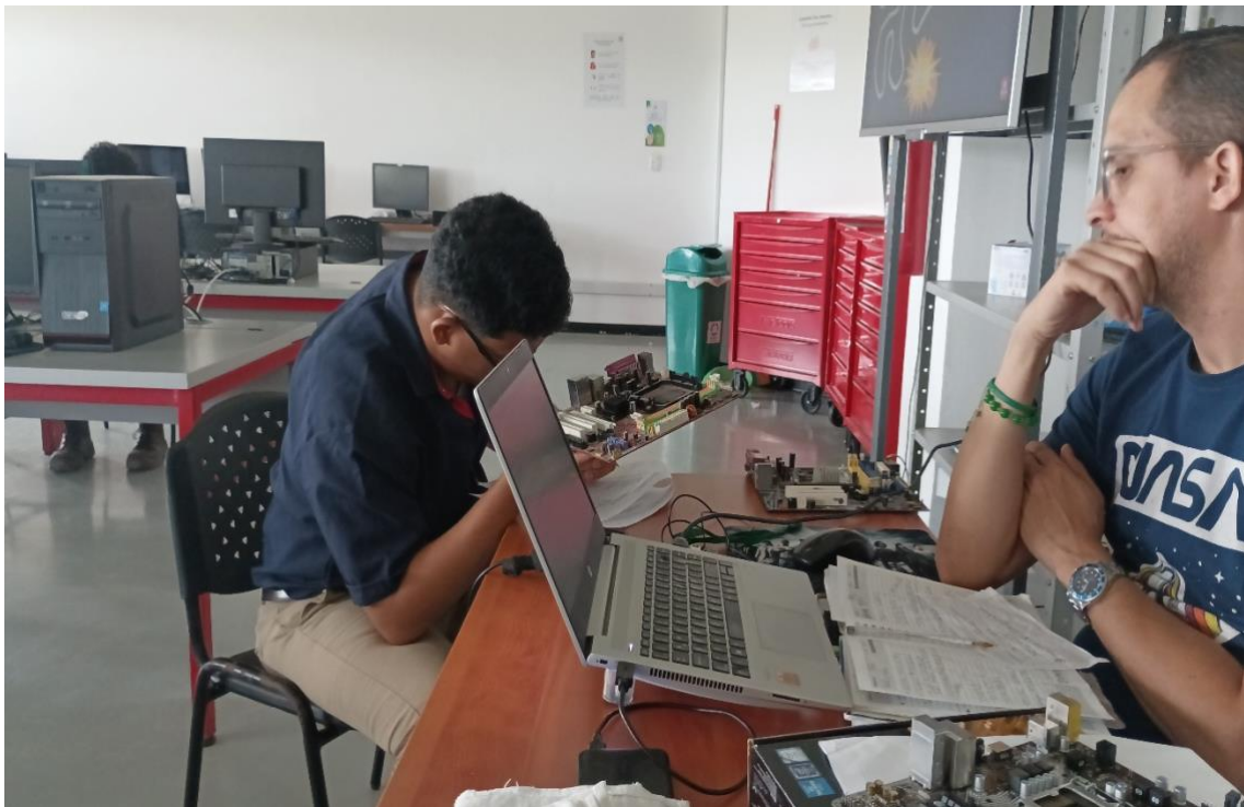
14-febrero-2025 evaluación reconociendo las partes de la tarjeta madre