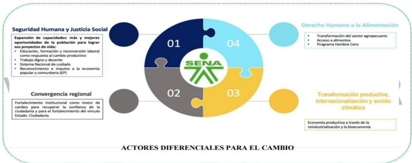
Ilustración 4 Alineación con Plan Nacional de Desarrollo 2022 – 2026

El Plan Estratégico 2023-2026 (Versión 2) define la proyección institucional hasta 2026, con visión a 2030, basándose en los principios, valores, compromisos, misión, visión, perspectivas, objetivos, iniciativas e indicadores estratégicos. El mapa estratégico resultante visualiza la estructura de la estrategia a través de objetivos orientados a la creación de valor público, definiendo las acciones, los derechos garantizados y las prioridades de la administración, en línea con las directrices del gobierno nacional.