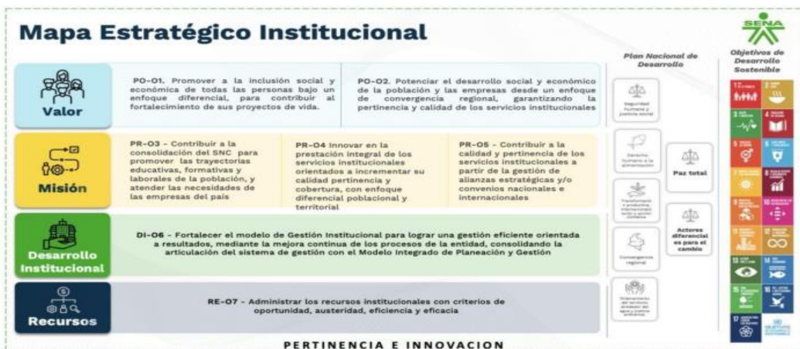
Ilustración 5 Mapa estratégico institucional

Utilizando la metodología del Balanced Scorecard, se elabora el mapa estratégico institucional con el objetivo de articular las cuatro perspectivas institucionales y, a través de habilitadores de pertinencia e innovación, lograr la creación de valor público.