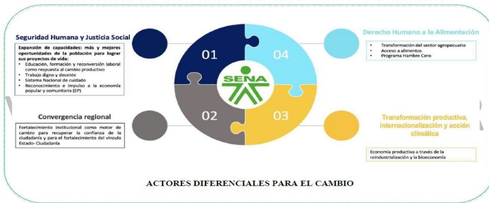
Ilustración 4 Alineación con Plan Nacional de Desarrollo 2022 – 2026