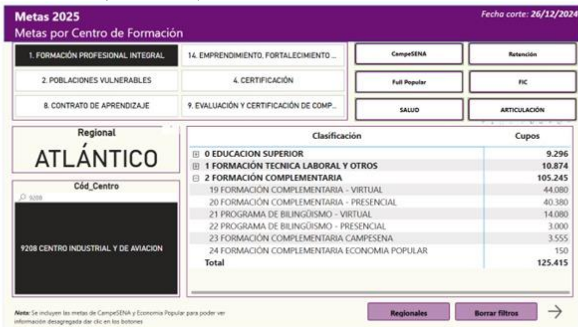
Tabla 2. Metas en formación Complementaria