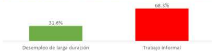
Tasa de desempleo de larga duración y tasa de informalidad de los sisbenizados en Tuluá (2022)