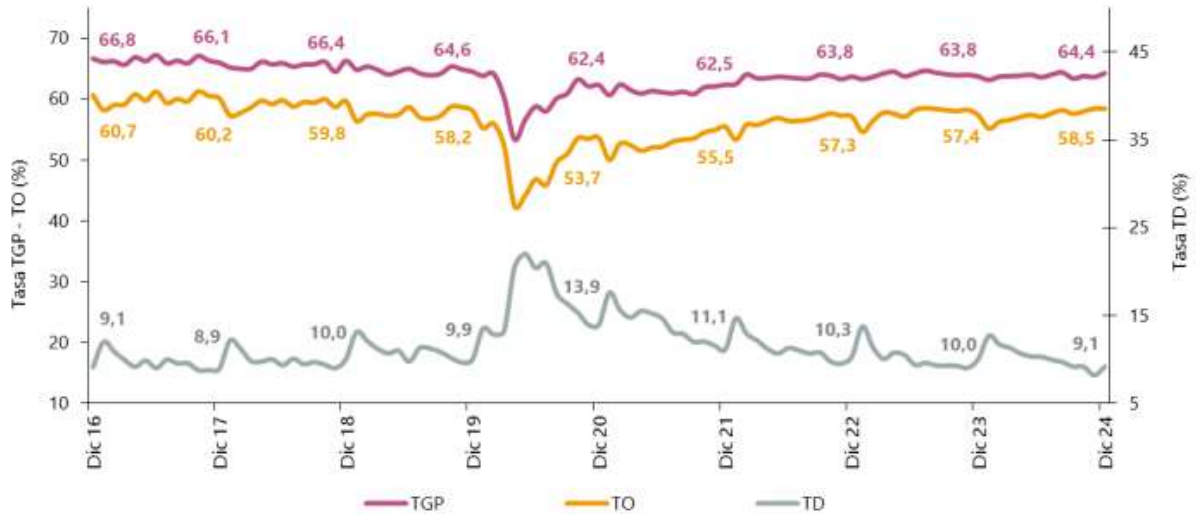
Gráfico 2. Tasa global de participación (TGP), Tasa de ocupación (TO) y Tasa de desocupación (TD) Total nacional Diciembre (2016 - 2024)

Fuente: DANE, GEIH. Nota: datos expandidos con proyecciones de población, elaboradas con base en los resultados del CNPV 2018. Nota: cifras aproximadas a un decimal.