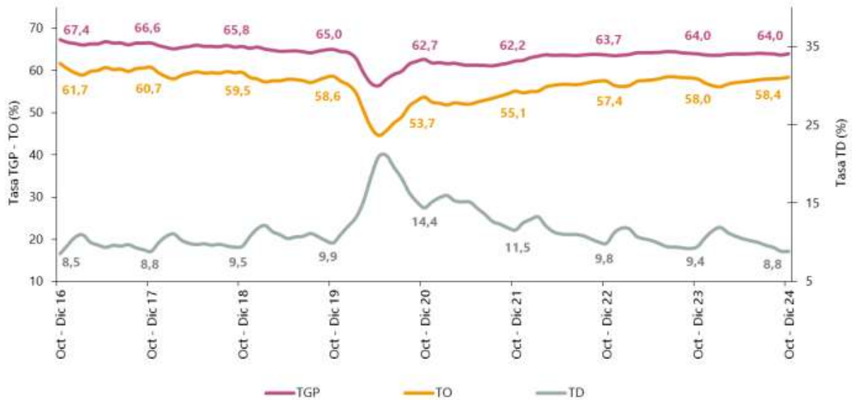
Gráfico 4. Tasa global de participación (TGP), Tasa de ocupación (TO) y Tasa de desocupación (TD) Total nacional Octubre - diciembre (2016 - 2024)

Fuente: DANE, GEIH. Nota: datos expandidos con proyecciones de población, elaboradas con base en los resultados del CNPV 2018. Nota: cifras aproximadas a un decimal.