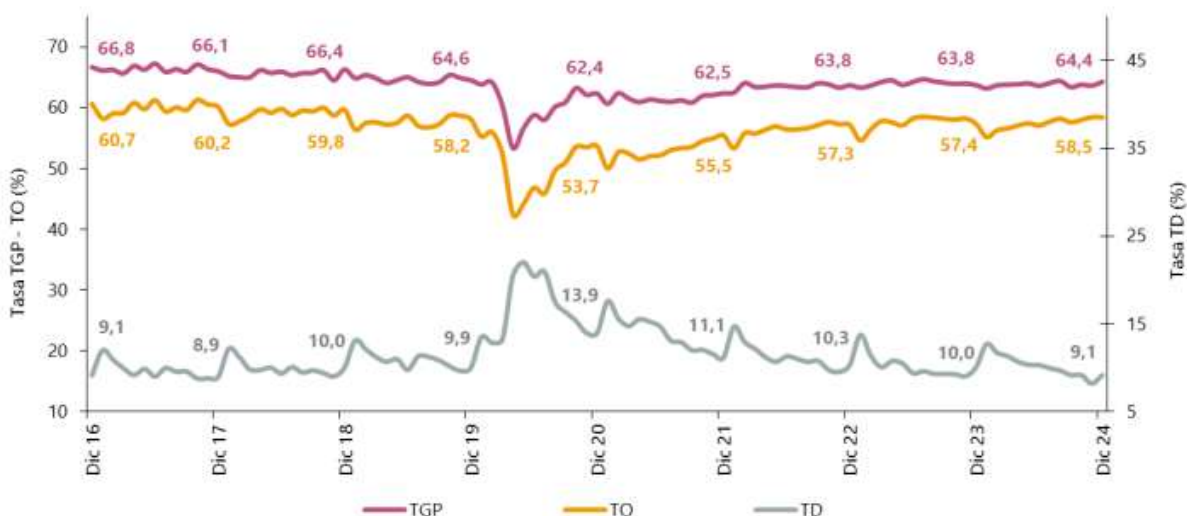
Gráfico 1. Tasa global de participación (TGP), Tasa de ocupación (TO) y Tasa de desocupación (TD) Total nacional Diciembre (2016 - 2024)

Fuente: DANE, Gran Encuesta Integrada de Hogares (GEIH). Nota: datos expandidos con proyecciones de población, elaboradas con base en los resultados del CNPV 2018. Nota: cifras aproximadas a un decimal.