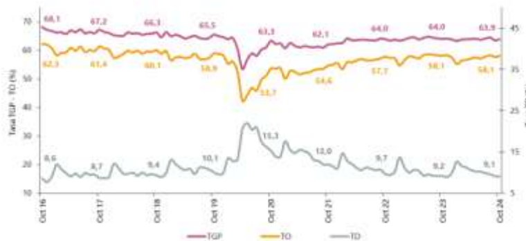
Gráfico 2. Tasa global de participación (TGP), Tasa de ocupación (TO) y Tasa de desocupación (TD) Total nacional Octubre (2016 - 2024)

Fuente: DANE, GEIH. Nota: datos expandidos con proyecciones de población, elaboradas con base en los resultados del CNPV 2018. Nota: cifras aproximadas a un decimal.