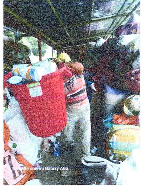
Tomada con mi Galaxy A03