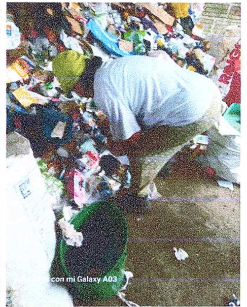
con mi Galaxy A03