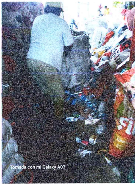
Tomada con mi Galaxy A03