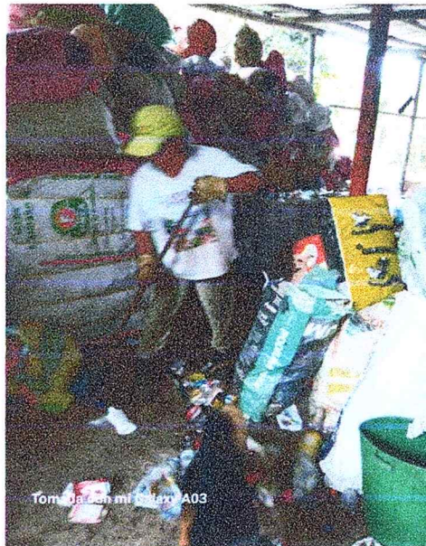
Tomada con mi Galaxy A03