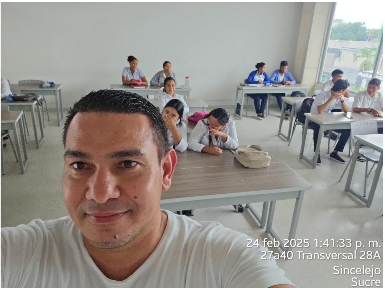
24 feb 2025 1:41:33 p. m. 27a40 Transversal 28A Sincelejo Sucre