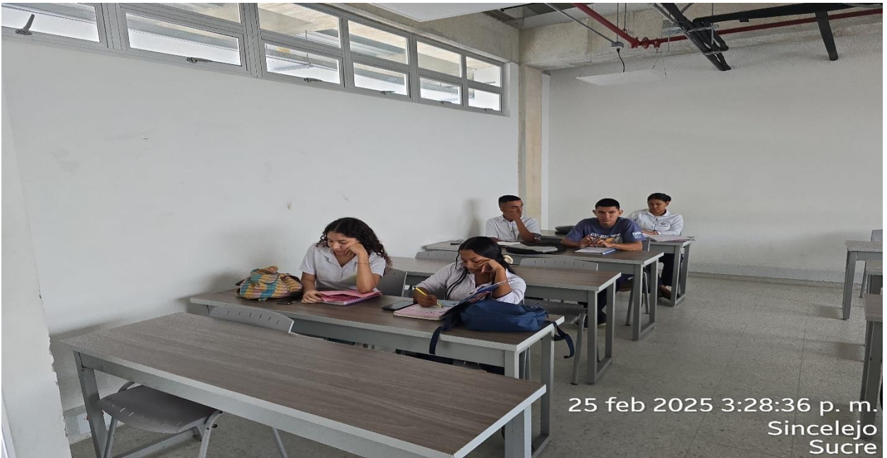
25 feb 2025 3:28:36 p. m. Sincelejo Sucre