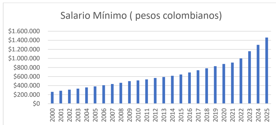
Grafico. Variación histórica del SMMLV en Colombia