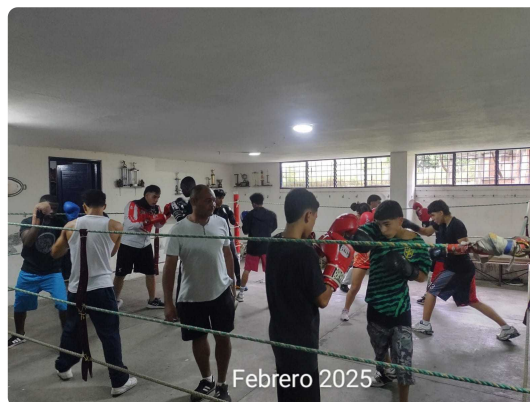
ESCUELA DE COMBATE