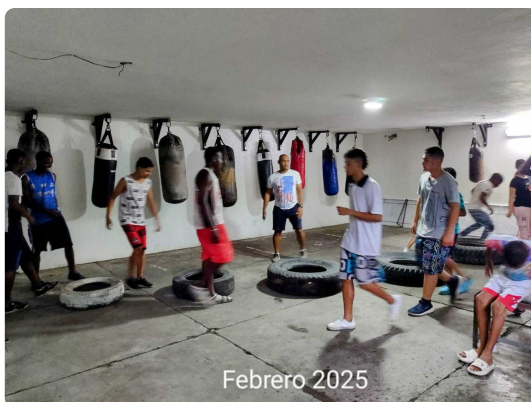
TRABAJO EN CIRCUITO

Informe actividades Contrato # IND-25-0787 de 2,025.