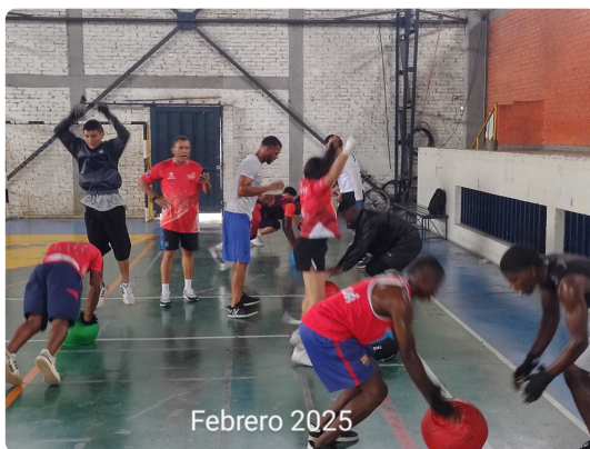
ACOPAÑAMIENTO DEL PREPARADOR FISICO