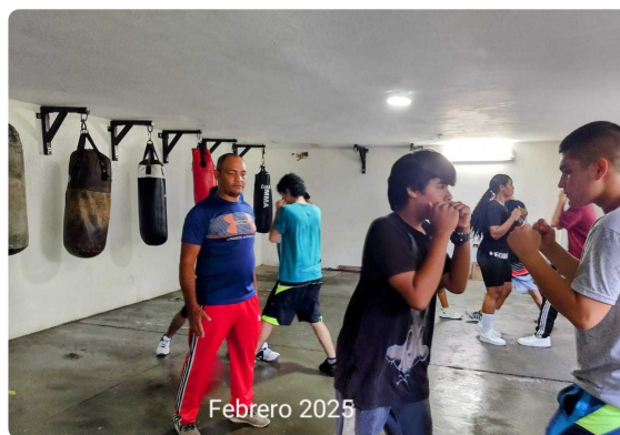
TRABAJO DE ESCUELA DE BOXEO