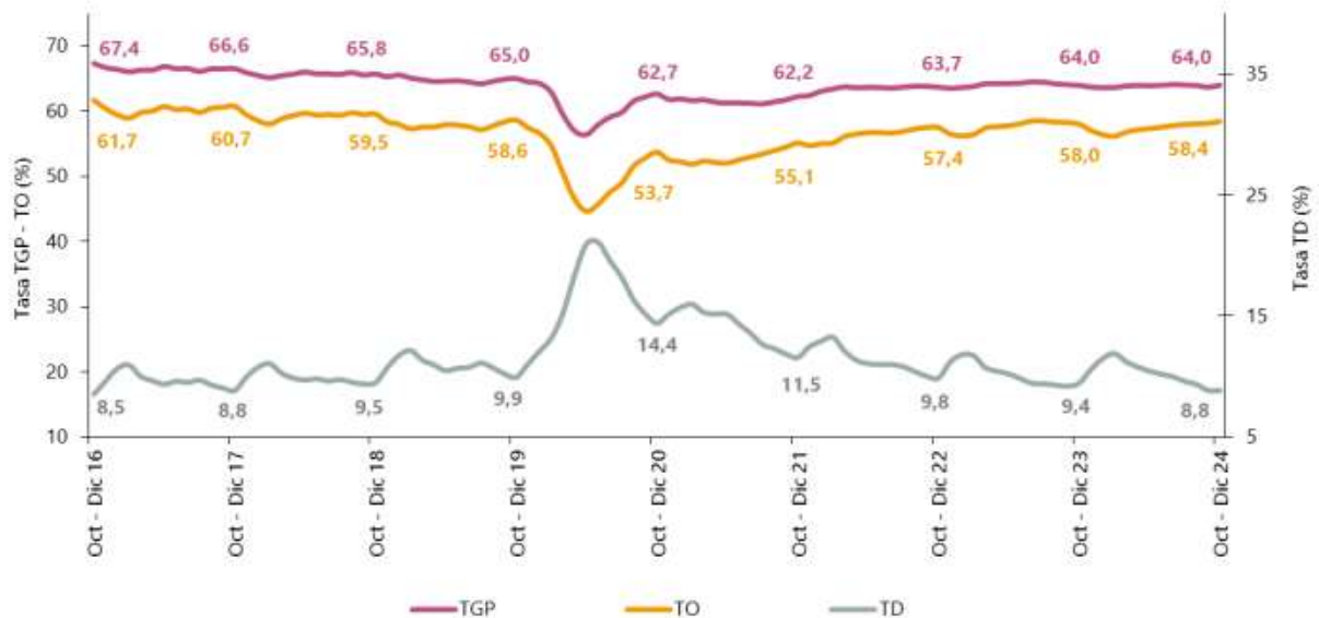
Gráfico 4. Tasa global de participación (TGP), Tasa de ocupación (TO) y Tasa de desocupación (TD) Total nacional Octubre - diciembre (2016 - 2024)

Fuente: DANE, GEIH. Nota: datos expandidos con proyecciones de población, elaboradas con base en los resultados del CNPV 2018. Nota: cifras aproximadas a un decimal.