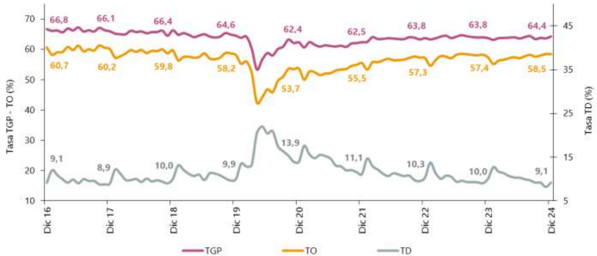
Gráfico 2. Tasa global de participación (TGP), Tasa de ocupación (TO) y Tasa de desocupación (TD) Total nacional Diciembre (2016 - 2024)

Fuente: DANE, GEIH. Nota: datos expandidos con proyecciones de población, elaboradas con base en los resultados del CNPV 2018. Nota: cifras aproximadas a un decimal.