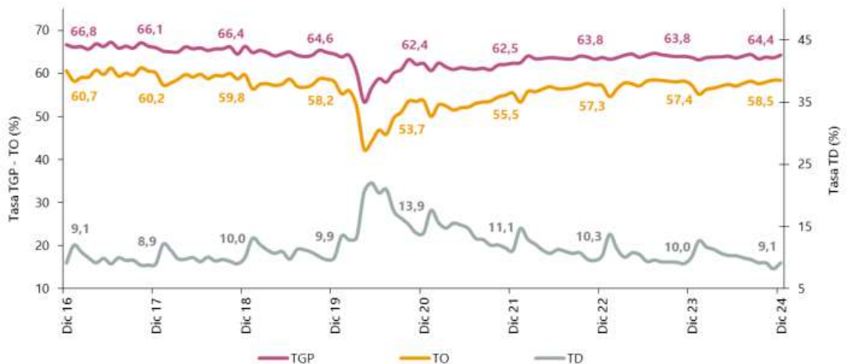
Gráfico 1. Tasa global de participación (TGP), Tasa de ocupación (TO) y Tasa de desocupación (TD) Total nacional Diciembre (2016 - 2024)

Fuente: DANE, Gran Encuesta Integrada de Hogares (GEIH). Nota: datos expandidos con proyecciones de población, elaboradas con base en los resultados del CNPV 2018. Nota: cifras aproximadas a un decimal.