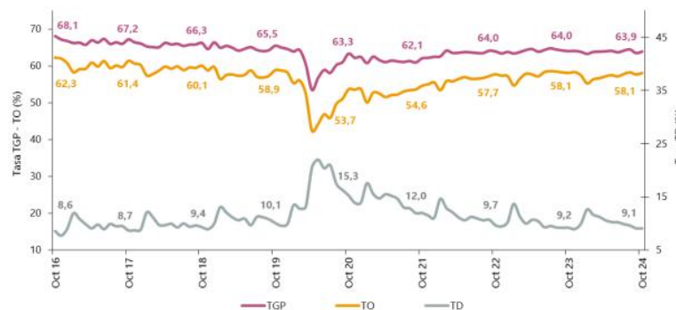
Gráfico 2. Tasa global de participación (TGP), Tasa de ocupación (TO) y Tasa de desocupación (TD) Total nacional Octubre (2016 - 2024)

1.1.1. Total nacional mensual Para el mes de octubre de 2024, la tasa de desocupación del total nacional fue 9,1%, mientras que en octubre de 2023 fue 9,2%. La tasa global de participación se ubicó en 63,9% y la tasa de ocupación en 58,1%, en el mismo mes del año anterior estas tasas fueron 64,0% y 58,1%, respectivamente.