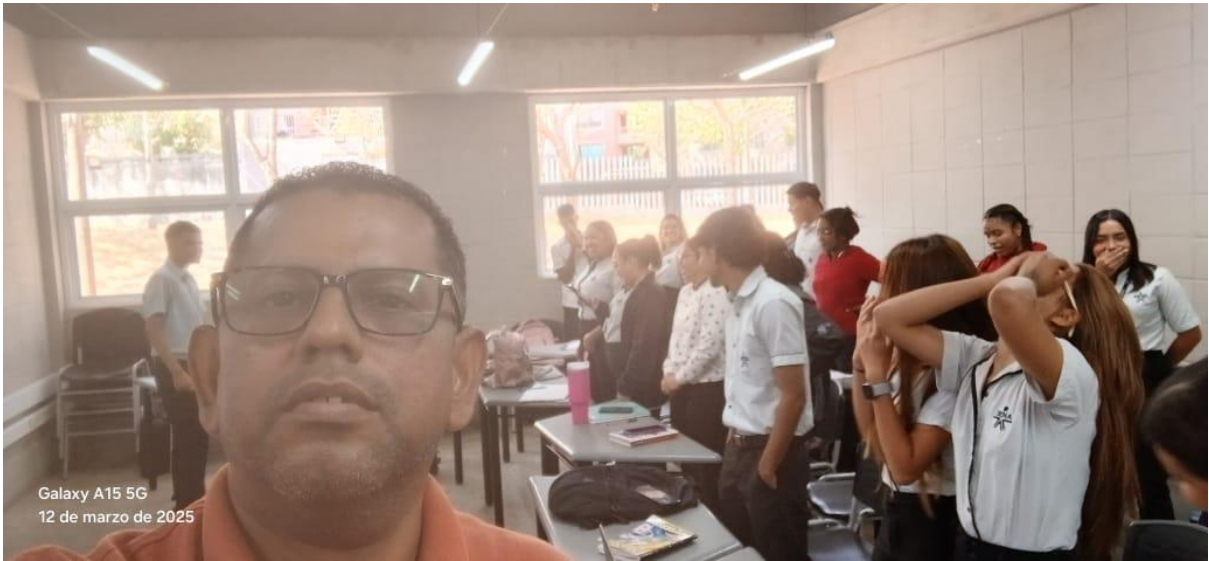
Galaxy A15 5G 12 de marzo de 2025