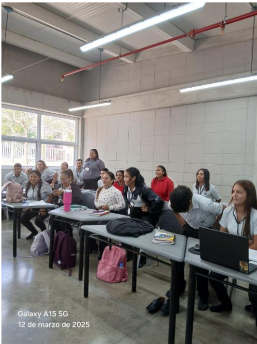
Galaxy A15 5G 12 de marzo de 2025