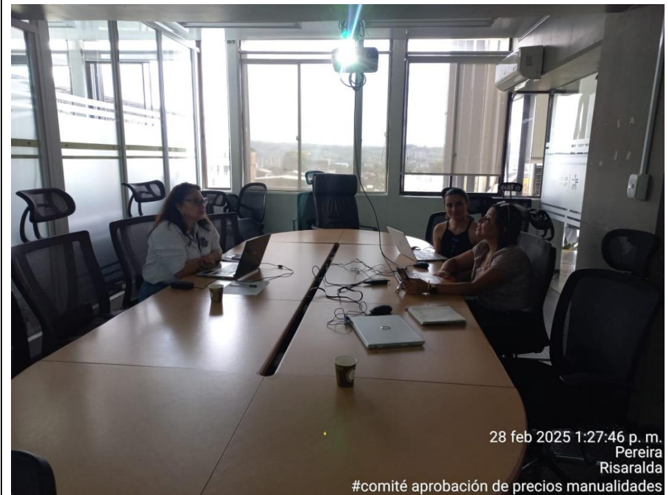
28 feb 2025 1:27:46 p. m. Pereira Risaralda #comité aprobación de precios manualidades