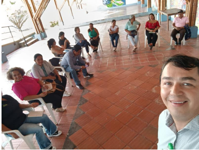
Formación en fortalecimiento en mercadeo y ventas 11 de marzo ficha 3177904