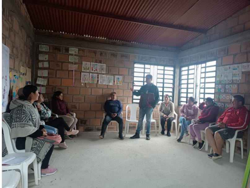
Ficha 3168040 del 6 de marzo de 2025