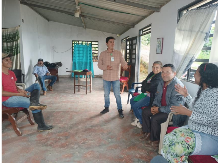
Formación en fortalecimiento en mercadeo y ventas 8 de marzo ficha 3181454