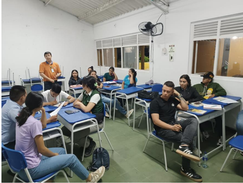
Formación en fortalecimiento en mercadeo y ventas 13 de marzo ficha 3168040