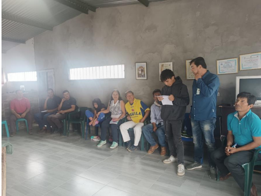
Formación en fortalecimiento en mercadeo y ventas 15 de marzo ficha 3181454