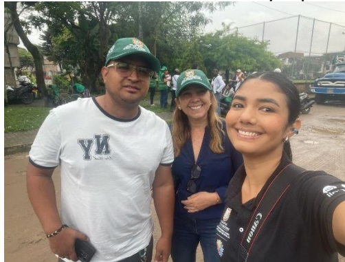
Cubrimiento Río Cali, Promotores Mi Cali Bella

El informe que presento resume las actividades programadas y ejecutadas en cumplimiento del objeto del contrato UAESP – PS No. 4182.010.26.1.208 de 2025 el cual queda a disposición del supervisor de la UAESP para sus observaciones, aclaraciones o ajustes.