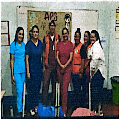
7. Apoyo brigadas de salud