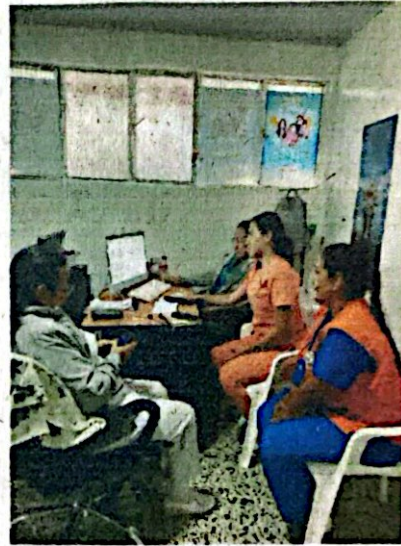
6. Revisión y seguimiento a cohorte