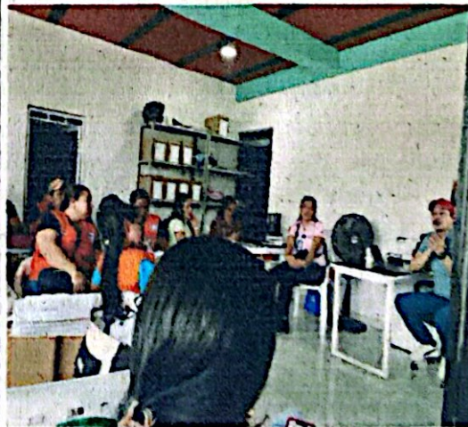
8. Reunión equipo APS