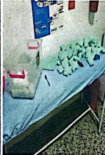
2. Alistamiento material