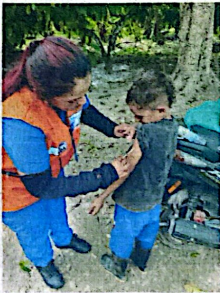
3. Vacunación rural