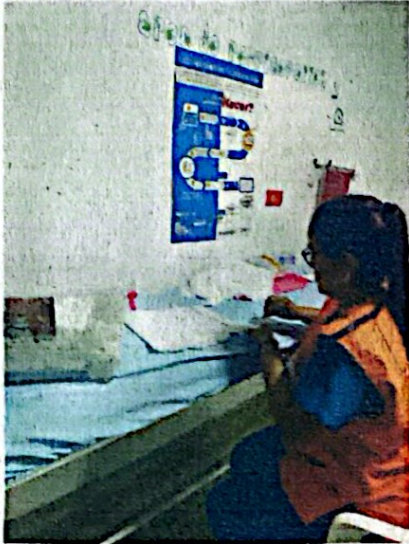
1. Alistamiento biológico