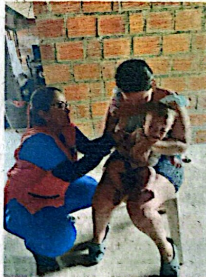
4. Vacunación urbano