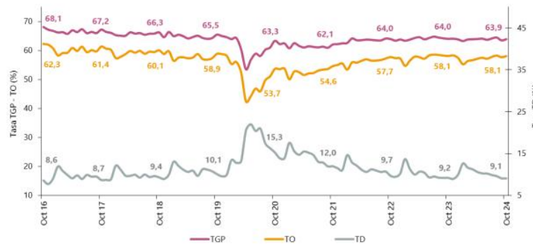
Gráfico 2. Tasa global de participación (TGP), Tasa de ocupación (TO) y Tasa de desocupación (TD) Total nacional Octubre (2016 - 2024)

1.1.1. Total nacional mensual Para el mes de octubre de 2024, la tasa de desocupación del total nacional fue 9,1%, mientras que en octubre de 2023 fue 9,2%. La tasa global de participación se ubicó en 63,9% y la tasa de ocupación en 58,1%, en el mismo mes del año anterior estas tasas fueron 64,0% y 58,1%, respectivamente.