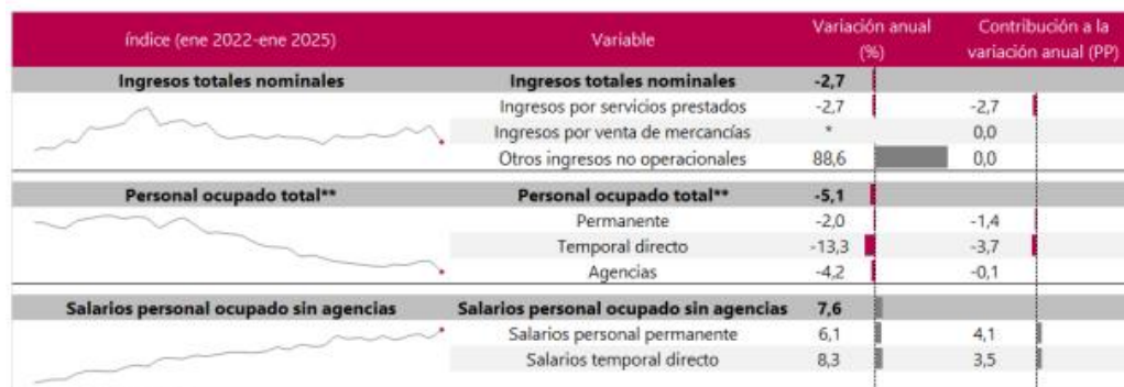
Tabla 8. Variación anual y contribución de los ingresos nominales por tipo, personal ocupado total y salarios por tipo de contratación Actividades de centros de llamadas (Call center) Total nacional Enero 2025 p

Variación anual: enero 2025p / enero 2024 En enero de 2025, los servicios de actividades de centros de llamadas (Call center) registraron una variación negativa de 2,7% en los ingresos nominales, el personal ocupado total presentó una disminución de 5,1% y los salarios registraron un crecimiento de 7,6%, en comparación con enero de 2024.