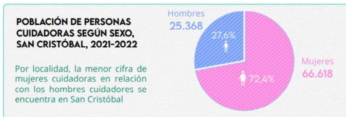
Ilustración 1. Población de personas cuidadoras según sexo.