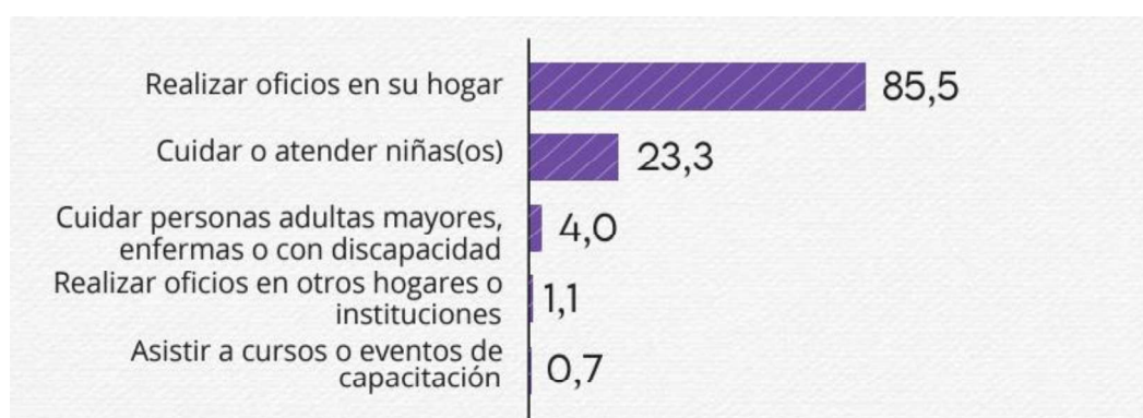
Ilustración 4. Actividades remuneradas además de la actividad principal.