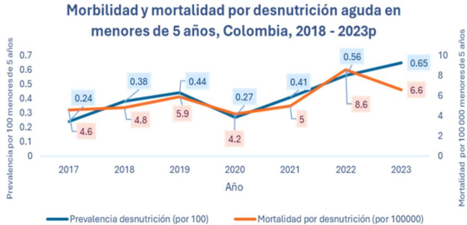
Fuente: Sistema de Vigilancia en Salud Pública (SIVIGILA)-Instituto Nacional de Salud (INS) datos preliminares semana 52.

El Ministerio de Salud y Protección Social mediante el Boletín de Prensa No. 4 de 2024, informa: