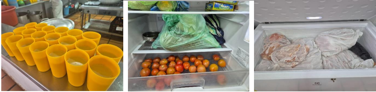
Realicé seguimiento a los alimentos entregados a los estudiantes del I.E San Vicente – Principal