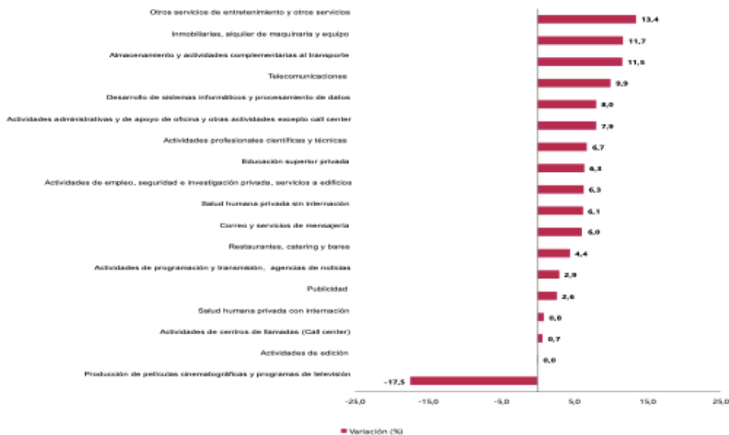
Gráfico 1. Variación anual de los ingresos nominales, según subsector de servicios Total nacional Febrero 2025 P / febrero 2024