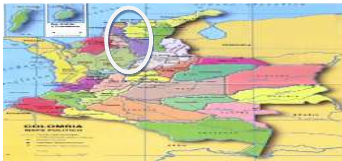
Imagen: Localización del Departamento de La Guajira – Colombia

El lugar de ejecución es el Municipio de Albania, La Guajira.