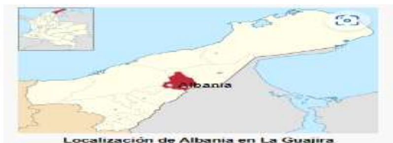
Localización de Albania en La Guajira.