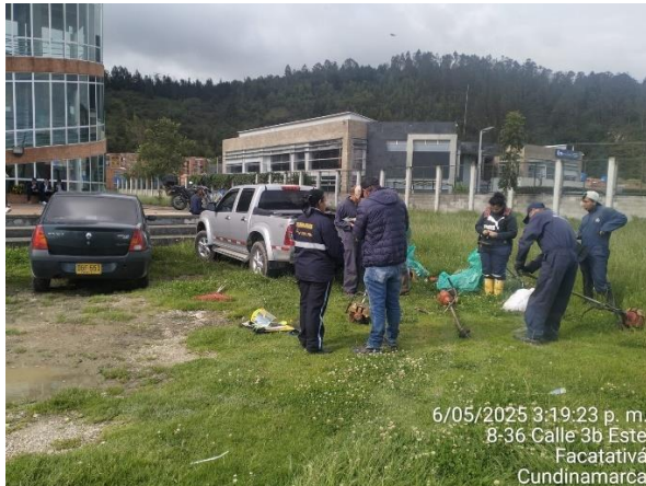
6/05/2025 3:19:23 p. m. 8-36 Calle 3b Este Facatativá Cundinamarca