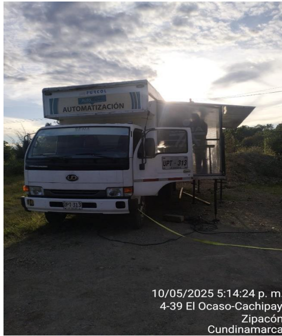
10/05/2025 5:14:24 p. m. 4-39 El Ocaso-Cachipay Zipacón Cundinamarca