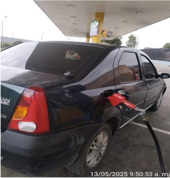
13/05/2025 9:50:53 a. m.