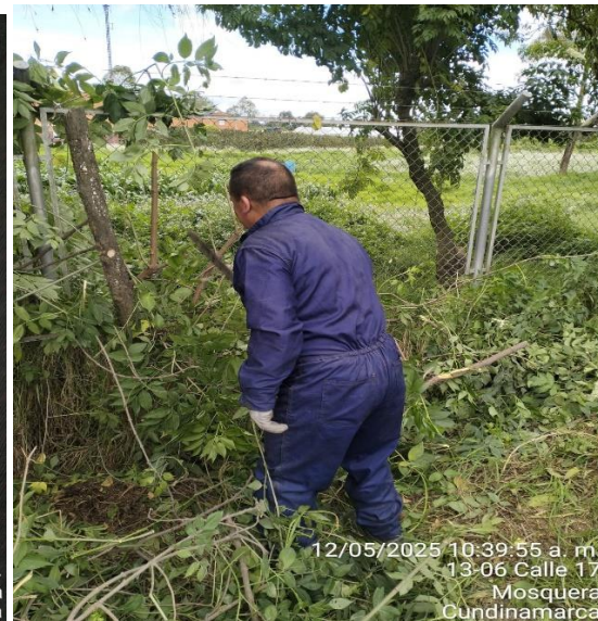
12/05/2025 10:39:55 a. m. 13-06 Calle 17 Mosquera Cundinamarca