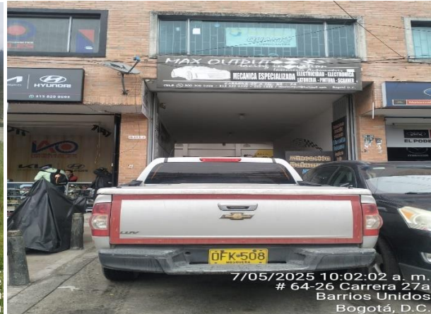
7/05/2025 10:02:02 a. m. # 64-26 Carrera 27a Barrios Unidos Bogotá, D.C.