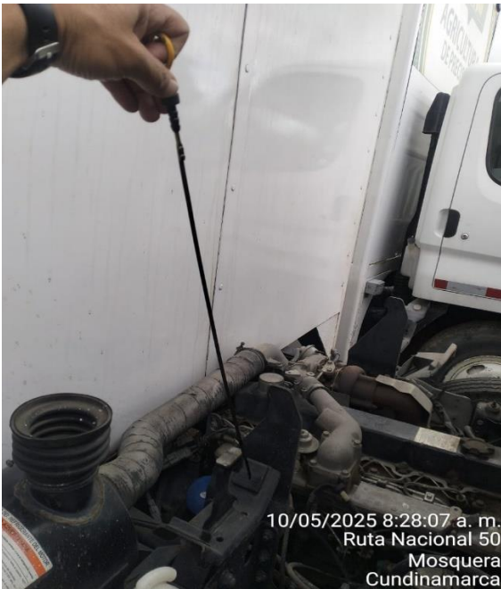
10/05/2025 8:28:07 a. m. Ruta Nacional 50 Mosquera Cundinamarca