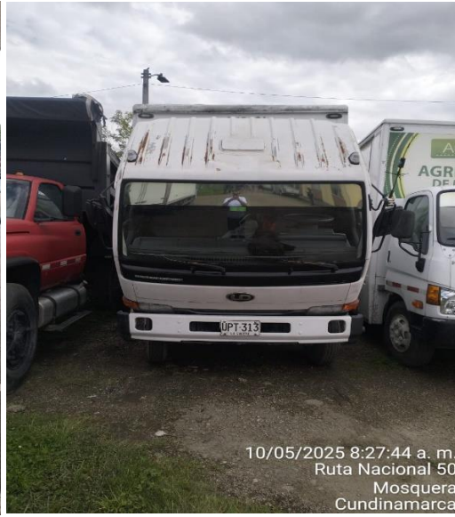
10/05/2025 8:27:44 a. m. Ruta Nacional 50 Mosquera Cundinamarca