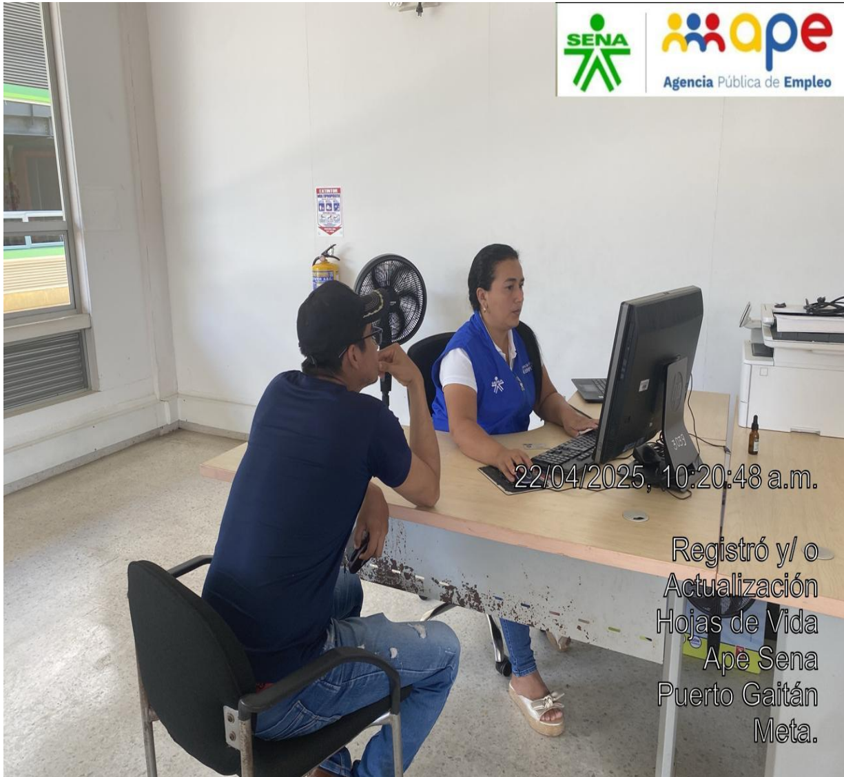
Ilustración 1. Atención en la oficina Satélite