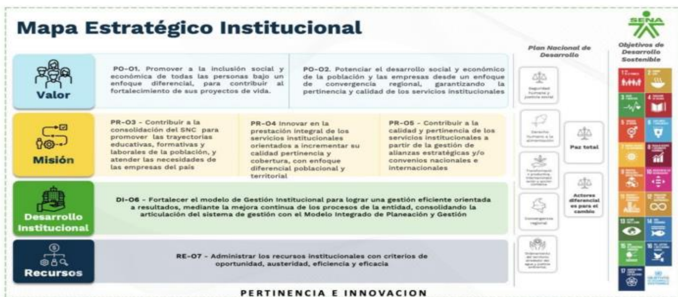
Ilustración 5 Mapa estratégico institucional

El desarrollo de una Formación Profesional Integral, conforme a la misión y visión del SENA, requiere la disposición de ambientes de aprendizaje adecuados, que incluyen espacios convencionales y especializados. El centro cuenta con una sede propia que alberga laboratorios, plantas y aulas convencionales, ofreciendo un punto de partida para las actividades formativas. Sin embargo, la capacidad actual de la infraestructura física es insuficiente para satisfacer las necesidades de la formación titulada presencial, lo que obstaculiza el logro de las metas trazadas y el pleno desarrollo de la oferta formativa.