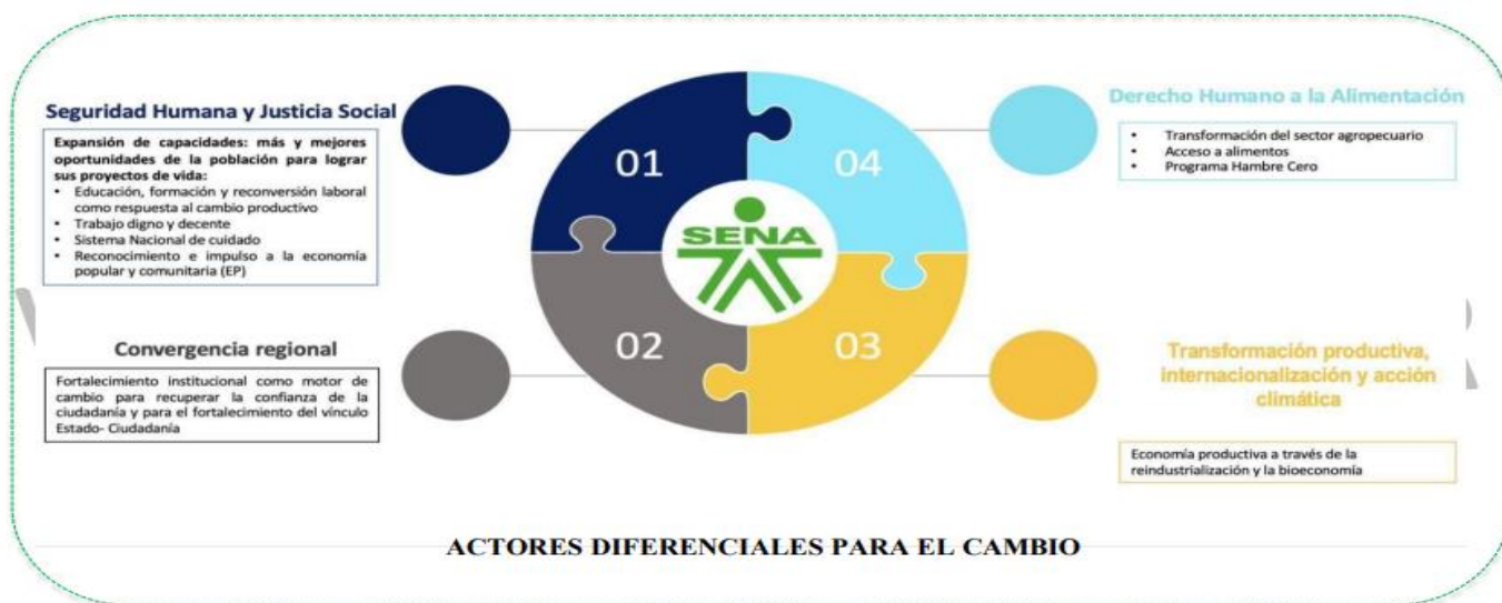
Ilustración 4 Alineación con Plan Nacional de Desarrollo 2022 – 2026

El Plan Estratégico 2023-2026 (Versión 2) define la proyección institucional hasta 2026, con visión a 2030, basándose en los principios, valores, compromisos, misión, visión, perspectivas, objetivos, iniciativas e indicadores estratégicos. El mapa estratégico resultante visualiza la estructura de la estrategia a través de objetivos orientados a la creación de valor público, definiendo las acciones, los derechos garantizados y las prioridades de la administración, en línea con las directrices del gobierno nacional.