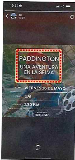
Anexo 13 evidencia redes sociales