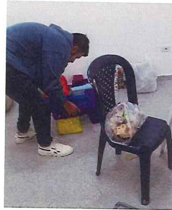
Anexo actividad 14 apoyo día de la madre