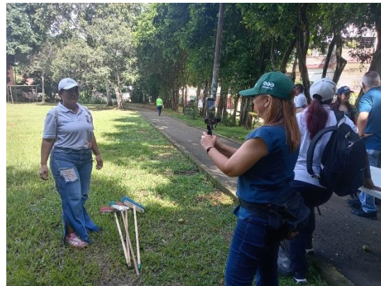
Visita Maecol con delegados Cuenca, Ecuador - Jornada de embellecimiento Primero de Mayo