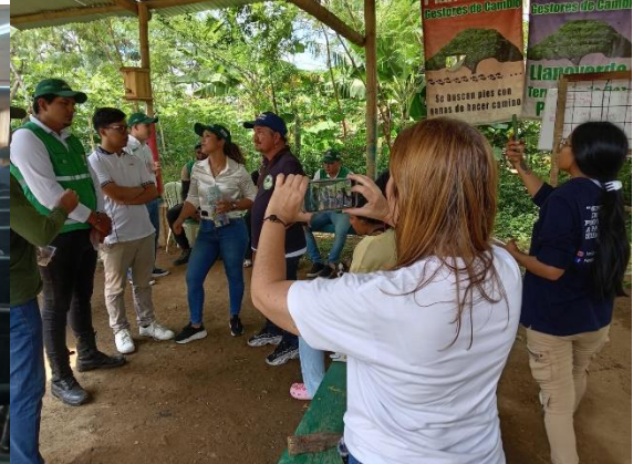
Primera Mesa Actualización Política Recicladores de Oficio -