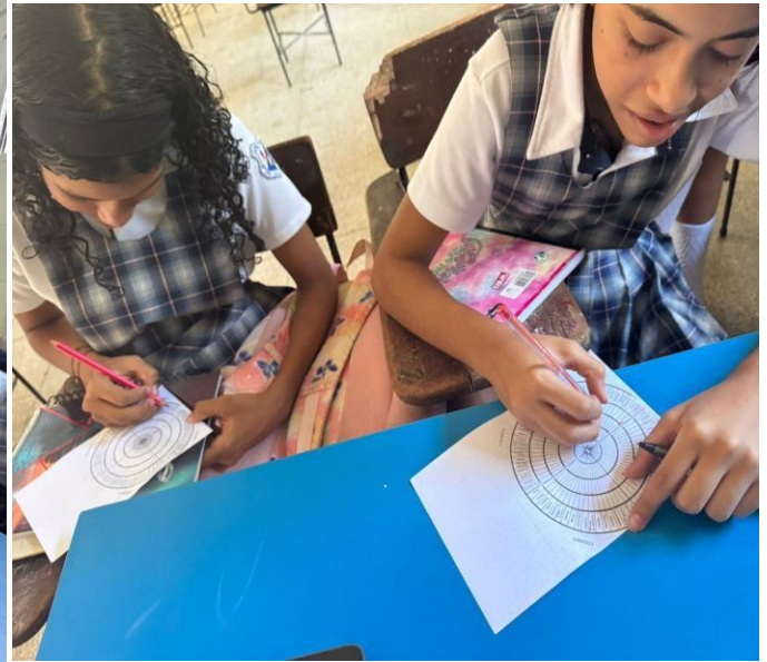
EVIDENCIA 4: Aprendices de la institución Educativa Francisco de Padua (Galapa) recibiendo formación complementaria en FORTALECIMIENTO EN APLICACIÓN DE LA ÉTICA Y HABILIDADES SOCIALES EN EL CONTEXTO LABORAL Tema principal: autoconocimiento (el temperamento)