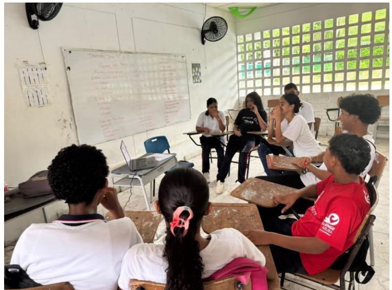
EVIDENCIA 2: Aprendices de la institución Educativa Técnica de la Peña recibiendo formación complementaria en FORTALECIMIENTO EN APLICACIÓN DE LA ÉTICA Y HABILIDADES SOCIALES EN EL CONTEXTO LABORAL