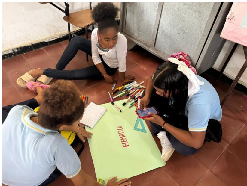
EVIDENCIA 3: Aprendices de la institución Educativa arroyo negro recibiendo formación complementaria en FORTALECIMIENTO EN APLICACIÓN DE LA ÉTICA Y HABILIDADES SOCIALES EN EL CONTEXTO LABORAL Tema principal: autoconocimiento (el temperamento)