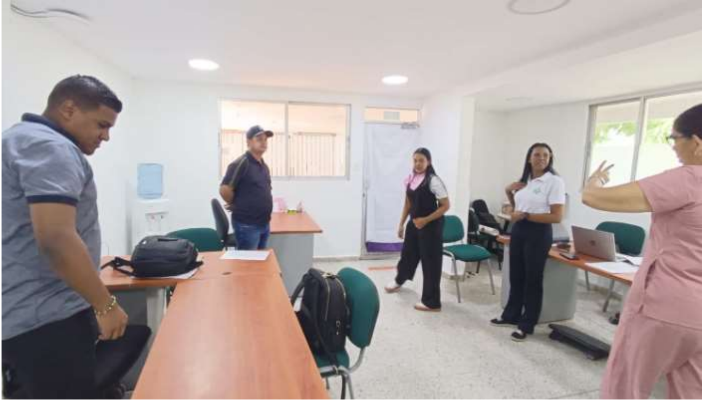
TALLER PARA EL COMITÉ DE CONVIVENCIA LABORAL