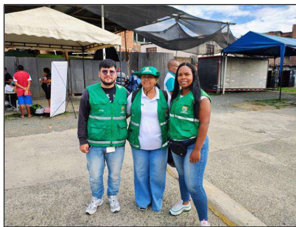
(03) Jornada de sensibilización, Barrio Marroquín, comuna 14.