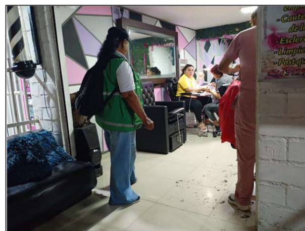
(02) Jornada de sensibilización, Barrio Alcázares, Comuna 6.