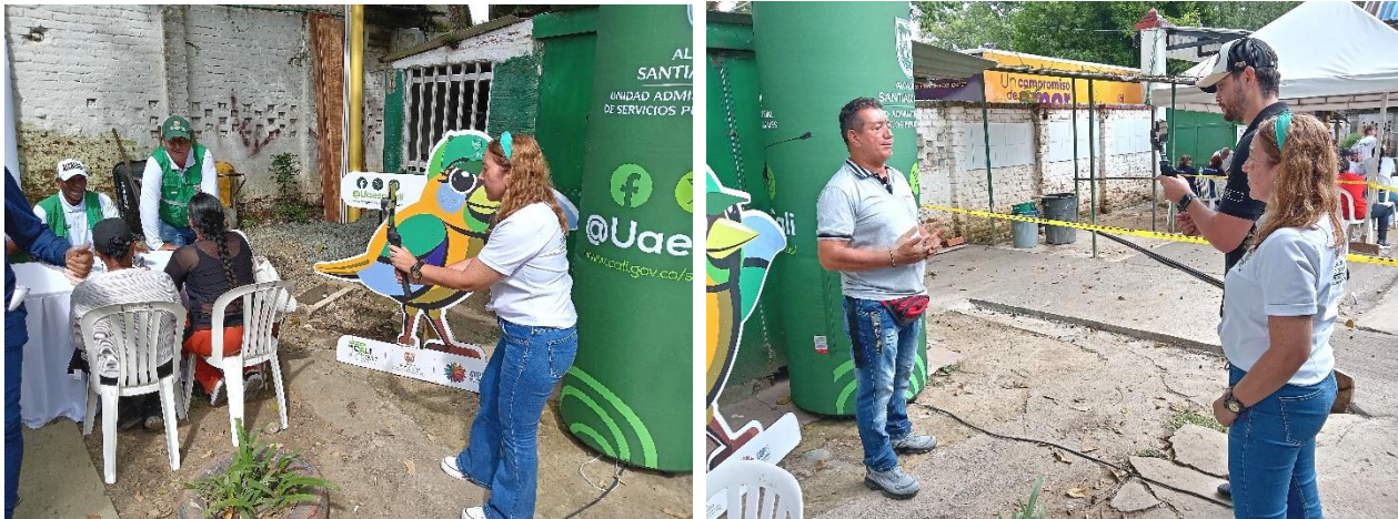
Feria de Servicios Corregimiento de Navarro