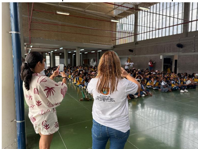
Entrega recuperación IE Llano Verde