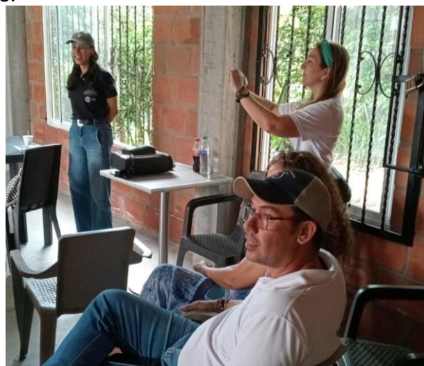
Sensibilización Proyecto de Saneamiento Básico Montebello