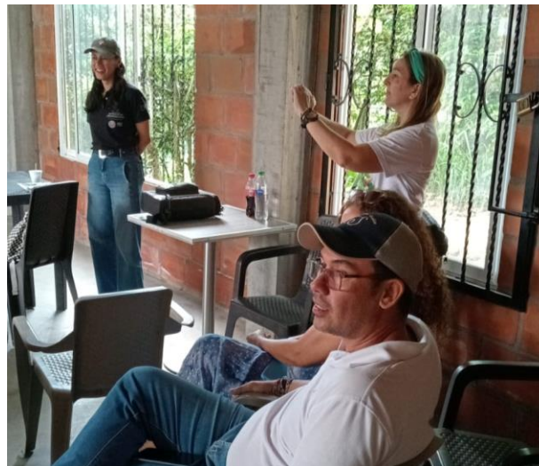
Sensibilización Proyecto de Saneamiento Básico Montebello