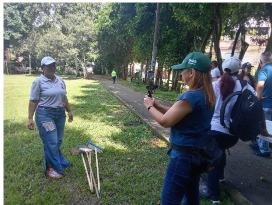
Visita Maecol con delegados Cuenca, Ecuador - Jornada de embellecimiento Primero de Mayo