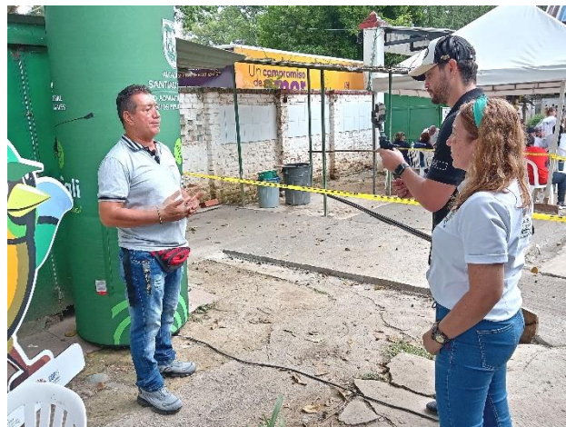
Feria de Servicios Corregimiento de Navarro

3. Brindar apoyo en la preproducción, producción y postproducción de contenidos dinámicos para la difusión de la prestación de los servicios públicos en los diferentes ecosistemas digitales sobre la gestión y alcances de los proyectos de la UAESP.