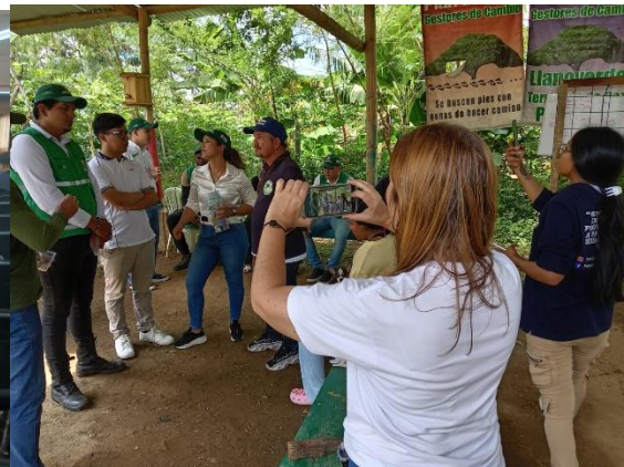
Primera Mesa Actualización Política Recicladores de Oficio -