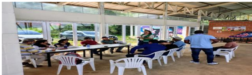
Socialización de contrato de obra mejoramiento de Ptap Villa del Rosario