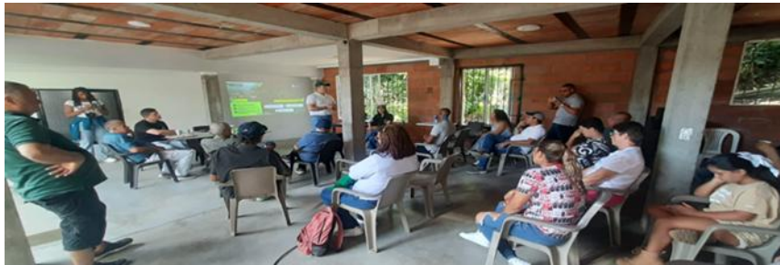
Socialización de obra PSMV para Montebello