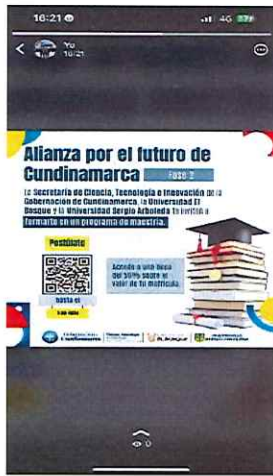
Anexo 13 evidencia redes sociales