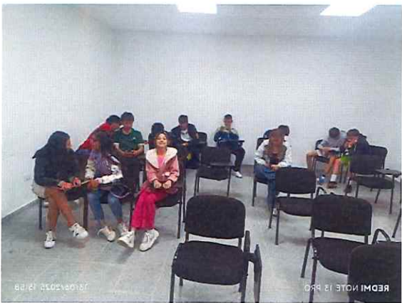
Anexo actividad 15 mesa de participación