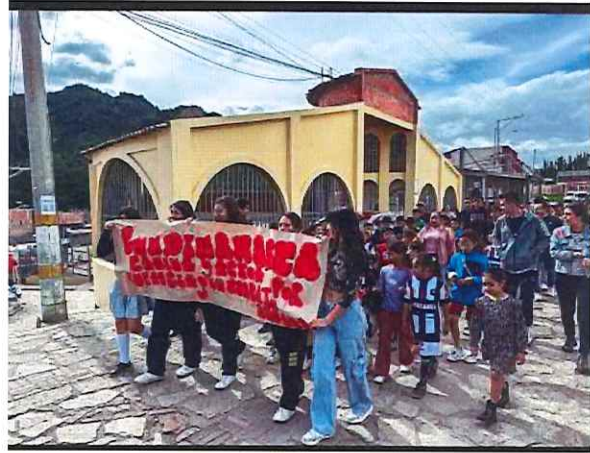
Anexo actividad 14 apoyo día de no al trabajo infantil