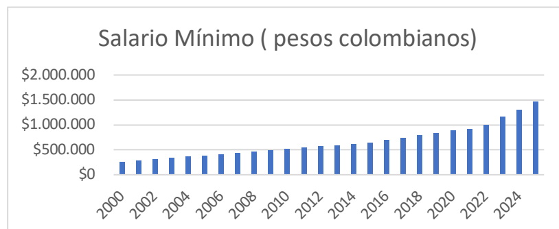
Grafico. Variación histórica del SMMLV en Colombia

Fuente: https://www.salariominimocolombia.net/historico/