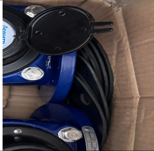
EMPAQUE PARA FLANCHE NEOLITE 3"