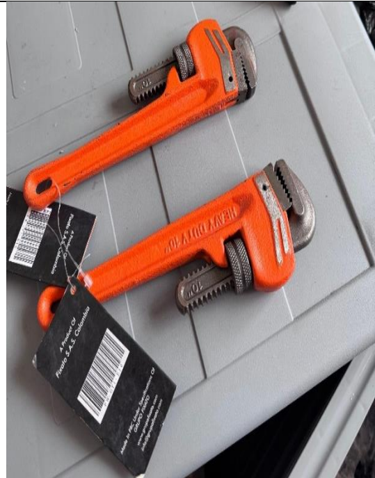
LLAVE DE TUBO N. 10