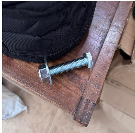
TORNILLO, TUERCA Y ARANDELA 5/8" POR 3.1/2