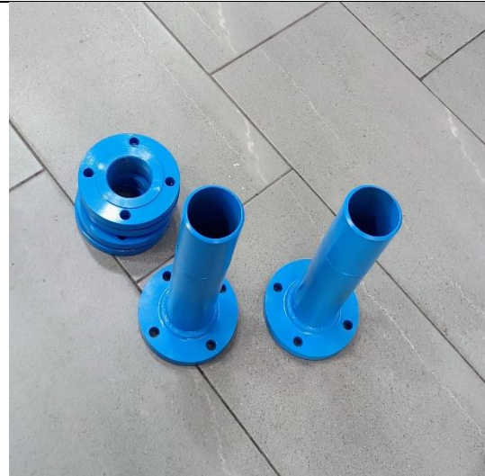
BRIDA DE 3" ESPIGO PARA PVC