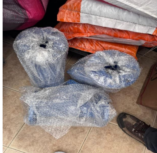
FILTRO BRIDA EN YEE HIERRO DUCTIL 3"