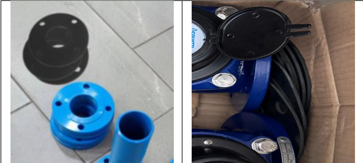
EMPAQUE PARA FLANCHE NEOLITE 3"