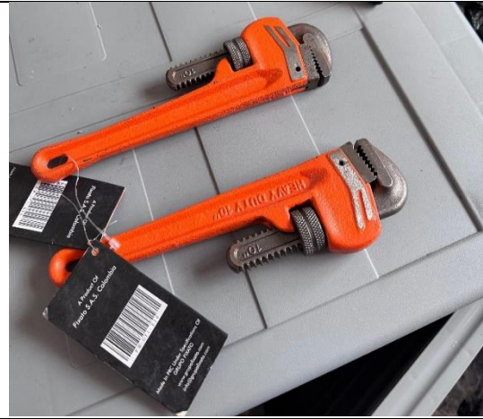
LLAVE DE TUBO N. 10